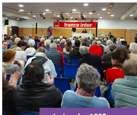
Le jeu des 1000 euros