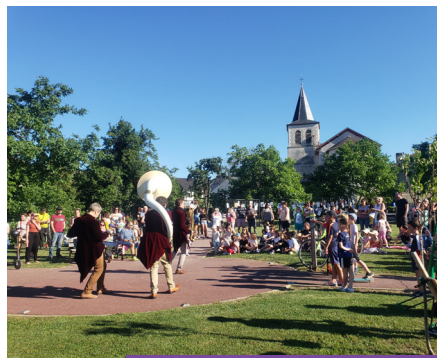
Les Vendredis de Valleiry