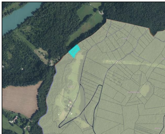
Parcelle A 250 à MATAILLY