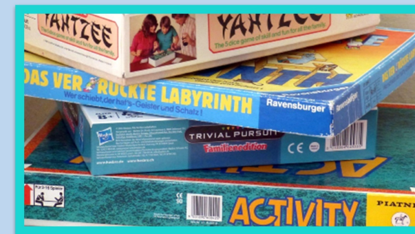
Jeux de société